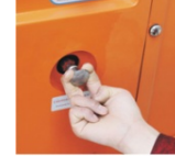
Emergency lowering system